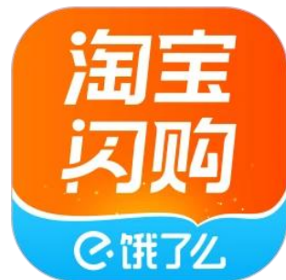
淘宝閃購 (Taobao Flash Shopping)